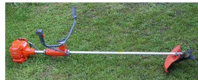
Buskrydderen giver meget alvorlige skader på pindsvinene.

Lægger man gift ud i haven, skal man vide, at den også er farlig for pindsvinene.