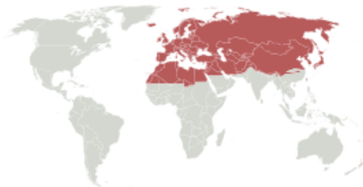
Kort over den palæarktiske zone* 3

Pindsvinet er et pattedyr. Der er 17 forskellige racer og 5 forskellige slægter af pindsvin. Vores, det europæiske pindsvin, lever i de palæoarctiske områder, der dækker Europa og Asien ned til omkring 30 grader nordlig bredde, undtagen i Himalaya. Pindsvinet lever så langt nordpå som til 60 grader nordlig bredde undtagen i Sverige, Norge, Finland, Estland og den nordvestlige del af Rusland, hvor de kan forekomme længere nordpå. Der findes ikke pindsvin i Australien og Nordamerika, og dem der lever i New Zealand, er indført andre steder fra.